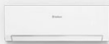
Jednostki wspólne dla serii climaVAIR plus