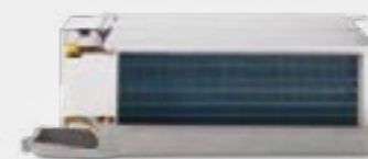
Montaż w kanałach sufitowych lub ściennych