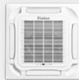
Montaż w sufitach podwieszanych