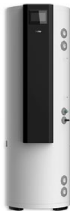
ZBIORNIK - 200l STOJĄCY