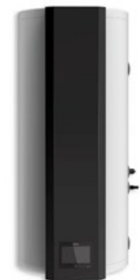
ZBIORNIK - 100l MONTAŻ SCIENNY