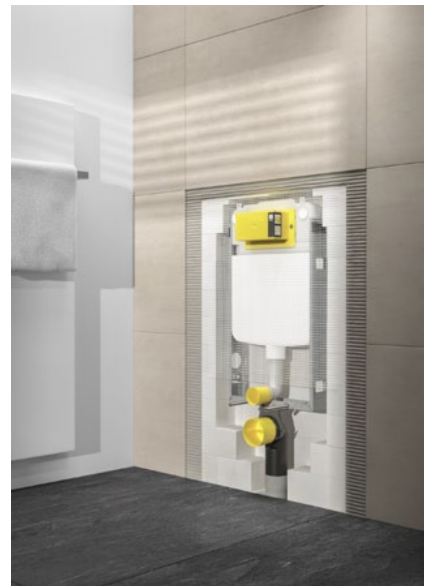
W asortymencie firmy Viega znajdziemy również warianty slim ze zbiornikiem o głębokości 8 cm. Na zdjęciu element Prevista Pure do zabudowy mokrej