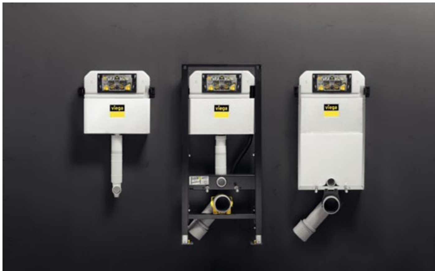
Elementy podtynkowe z serii Prevista charakteryzują się niewielką głębokością zabudowy. Standardowy stelaż Prevista Dry ma zbiornik o głębokości jedynie 12 cm

W asortymencie firmy Viega znajdziemy również wariant slim ze zbiornikiem o głębokości 8 cm, przy zachowaniu typowej szerokości 50 cm. Jako alternatywne rozwiązanie można też zastosować element Prevista Pure – czyli spłuczkę przygotowaną do zabudowy mokrej, oferowaną również w wersji ze zbiornikiem 8 cm. Mniejsza głębokość zabudowy pozwala zyskać cenne centymetry, co w małej łazience ma szczególne znaczenie.