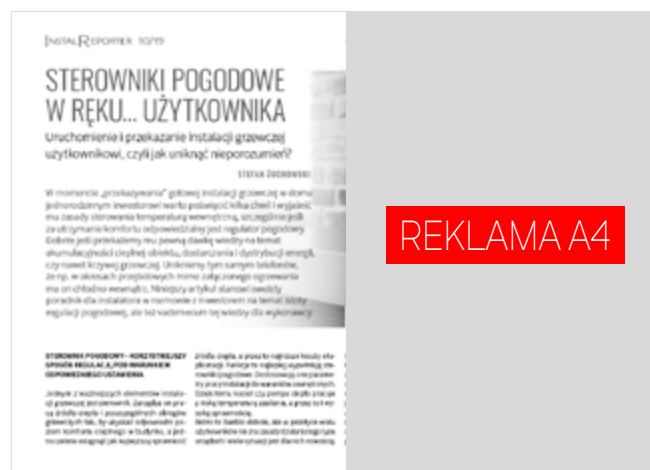
1 strona na spad: 207x297 mm Cena: 2000 zł + VAT