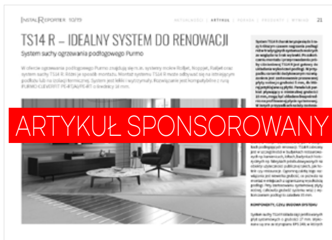
Artykuł sponsorowany złamany wg makiety czasopisma Cena: 1800 zł + VAT

ssmiecincka@instalreporter.pl mtomasik@instalreporter.pl