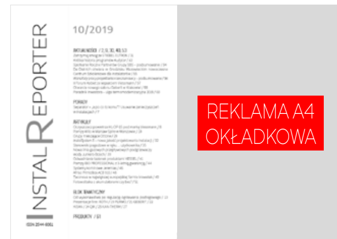
1 strona okładkowa obok spisu treści: na spad 207x297 mm Cena: 2500 zł + VAT