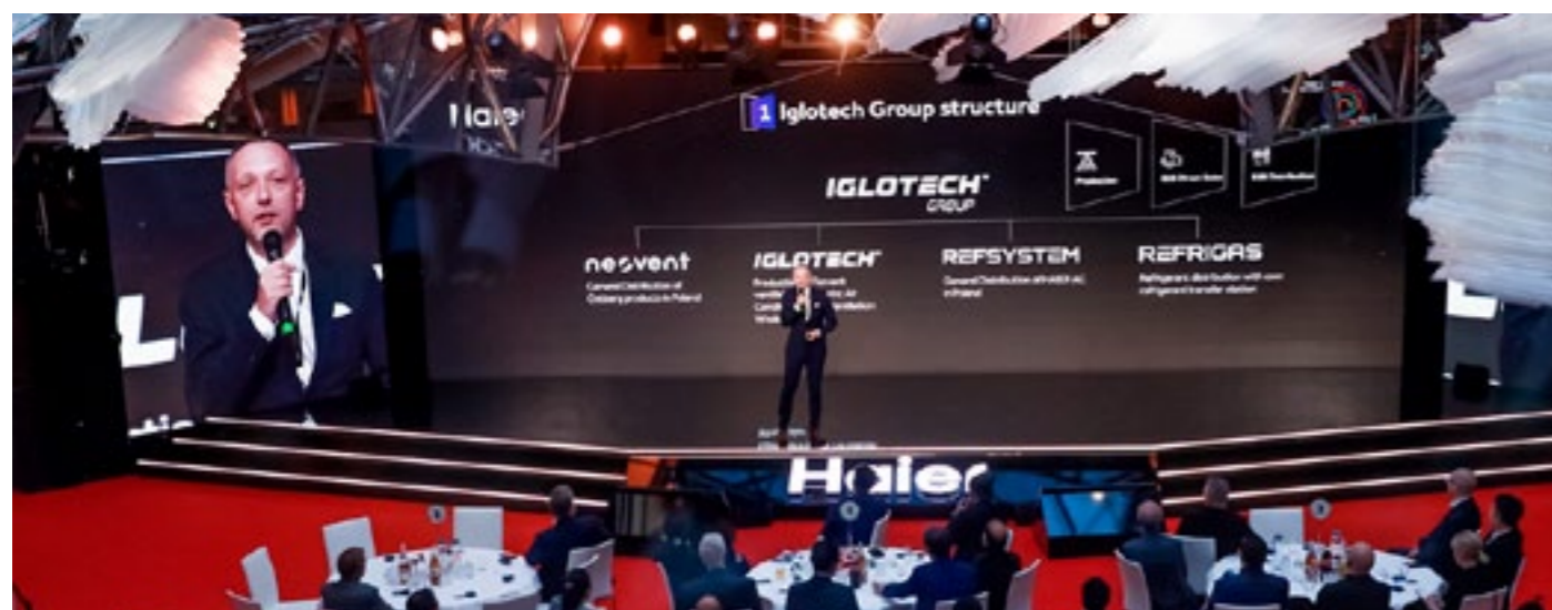
Refsystem wystąpił w roli prelegenta na światowym szczyt. Case study rozwoju marki Haier w Polsce został przedstawiony jako wzór godny naśladowania

Udział Refsystem w tak prestiżowej uroczystości pokazuje dynamikę rozwoju marki Haier w Polsce oraz ugruntowuje wiodącą pozycję firmy na rynku. To wyraz zaufania do reprezentowanego systemu zarządzania, stawiającego na relacje w procesie budowania marki. Dzięki tak realizowanej strategii Refsystem motto tegorocznego szczytu Win the New Era Together wybrzmiewa jeszcze bardziej.