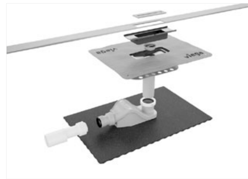
Viega Advantix Cleviva

Najpopularniejsze odwodnienia liniowe firmy Viega Advantix Vario dostępne są w wersjach podłogowych ściennych oraz w kilku wariantach kolorystycznych. Najbardziej popularne kolory to stal nierdzewna matowa, stal polerowana