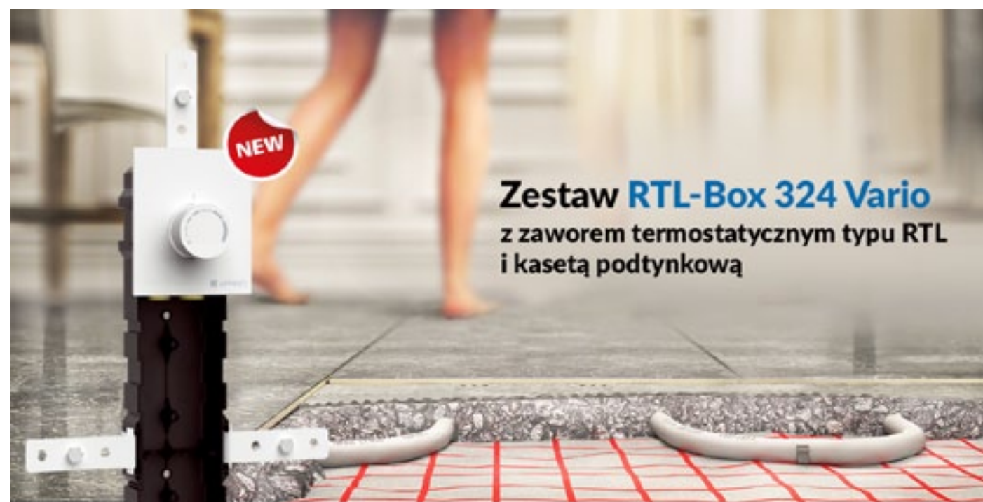
Zestaw RTL-Box 324 Vario z zaworem termostatycznym typu RTL i kasetą podtynkową

Jak regulować temperaturę w miejscach, które do tej pory były ogrzewane wyłącznie przez grzejnik i nie zrujnować wyglądu pomieszczenia skomplikowanym, trudnym w podłączeniu urządzeniem? Sprawdźcie nowość AFRISO: zestaw RTL-Box 324 Vario.