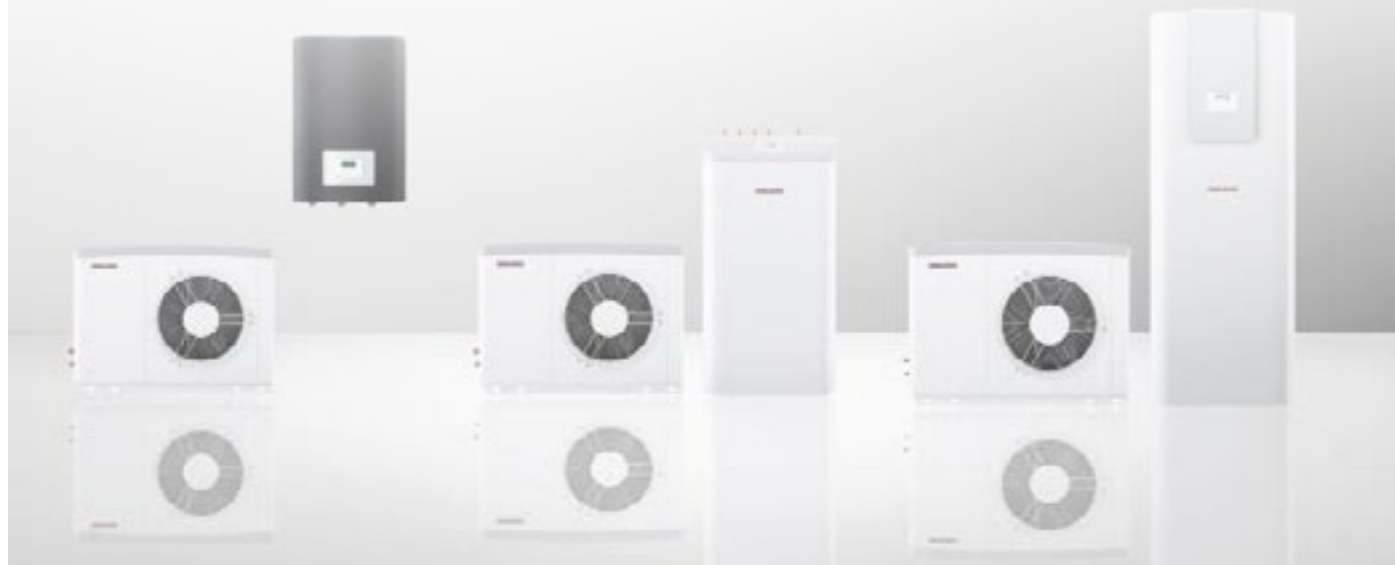
Pakiet HPA-O 8CS Plus compact D Set