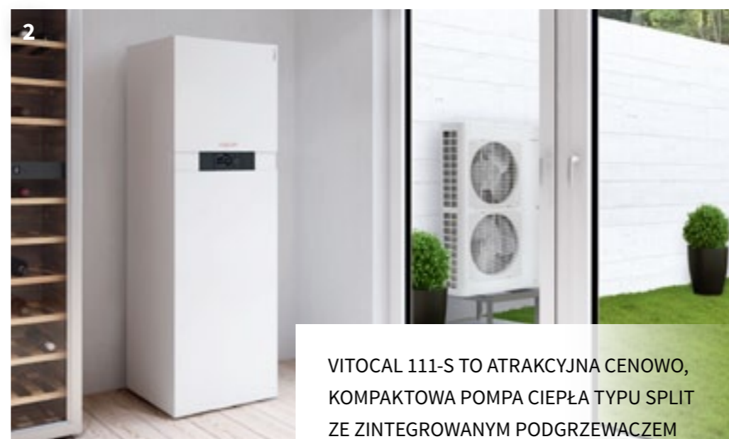
2 VITOCAL 111-S TO ATRAKCYJNA CENOWO, KOMPAKTOWA POMPA CIEPŁA TYPU SPLIT ZE ZINTEGROWANYM PODGRZEWACZEM C.W.U. O POJEMNOŚCI 220 LITRÓW.