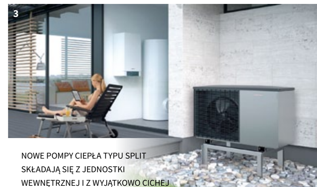
3 NOWE POMPY CIEPŁA TYPU SPLIT SKŁADAJĄ SIĘ Z JEDNOSTKI WEWNĘTRZNEJ I Z WYJĄTKOWO CICHEJ JEDNOSTKI ZEWNĘTRZNEJ.