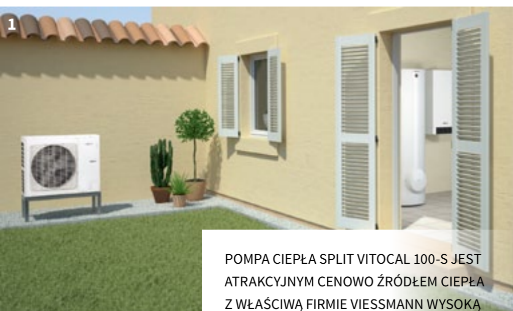
1 POMPA CIEPŁA SPLIT VITOCAL 100-S JEST ATRAKCYJNYM CENOWO ŹRÓDŁEM CIEPŁA Z WŁAŚCIWĄ FIRMIE VISSMANN WYSOKĄ JAKOŚCIĄ WYKONANIA I EFEKTYWNOŚCIĄ.

Zapytanie potencjalnego beneficjenta kierowane jest do wybranej firmy partnerskiej Viessmann, która została przeszkolona z obsługi programu Czyste Powietrze.