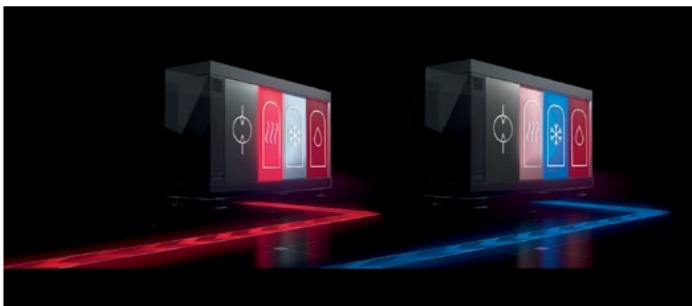
System C – wersja zaawansowana do ogrzewania i chłodzenia, jak również do przygotowania ciepłej wody użytkowej. Elementy systemu: pompa ciepła powietrze/woda 60 kW, umieszczona na zewnątrz, jest połączona ze stacją hydrauliczną z dwoma zbiornikami buforowymi pojemności 1000 l i zasobnikiem c.w.u. 700 l

przedsięwzięciu i może być produkowany seryjnie. Zapotrzebowanie na ogrzewanie, chłodzenie i ciepłą wodę użytkową musi zostać zaspokojone przy maksymalizacji efektywności energetycznej w dużych pomieszczeniach mieszkalnych lub biurowych, np. na