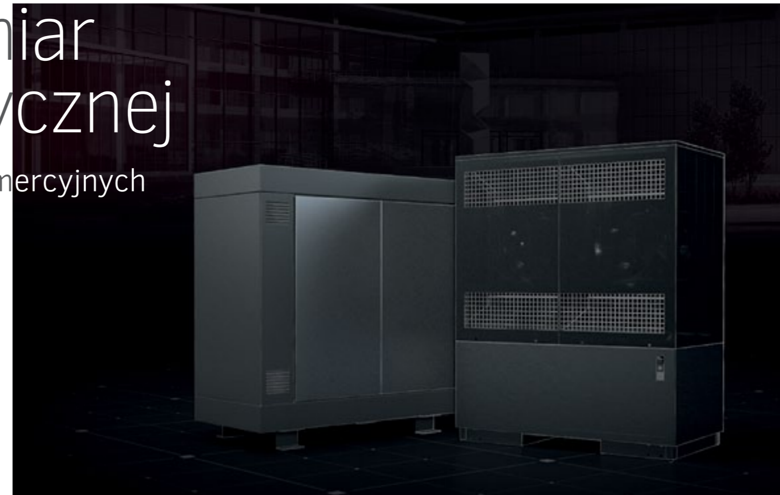
System C – modułowy, dostosowany do potrzeb, oparty na najnowocześniejszej technologii pomp ciepła. Moc cieplna i wydajność chłodzenia są dostosowane do projektu budowlanego

Pompa ciepła w układzie glikol/woda dodatkowo zintegrowana z jednostką hydrauliczną Systemu C