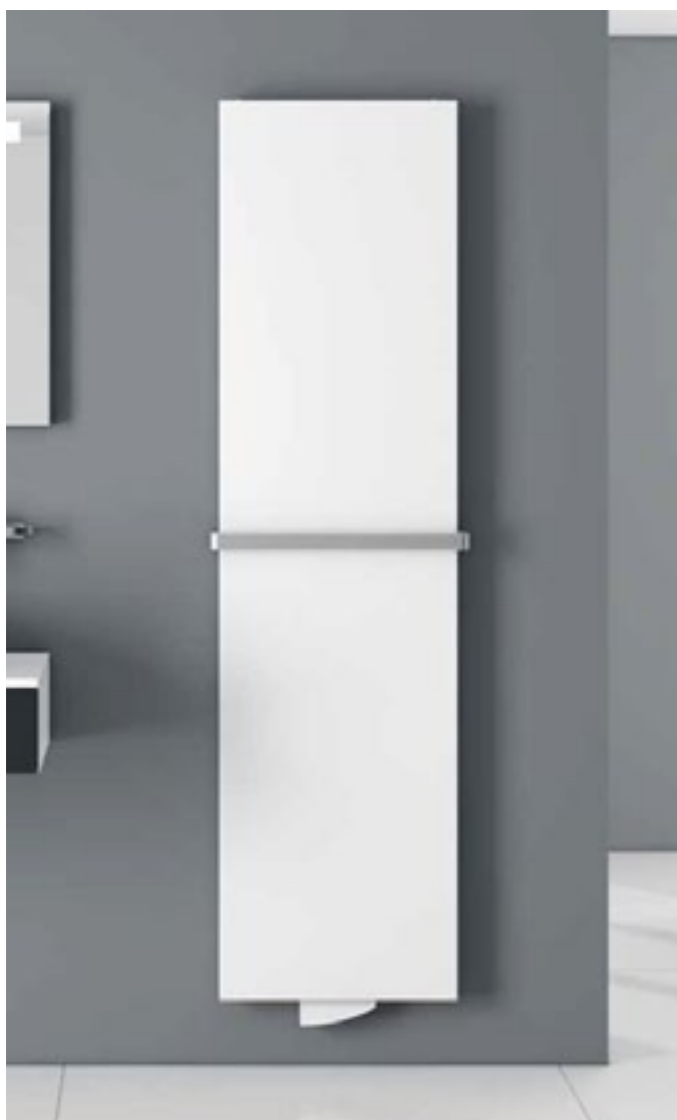
TARA – pionowy grzejnik dekoracyjny z gładką płytą czołową. Ze względu na swoje kompaktowe rozmiary (głębokość zaledwie 73 mm) idealnie pasuje do każdego pomieszczenia. TARA to połączenie najwyższej jakości materiałów oraz wysokiej mocy grzewczej. Wymiary: szer. 325, 475, 625 i 775 mm, wys. 1800, 1950 i 2100 mm