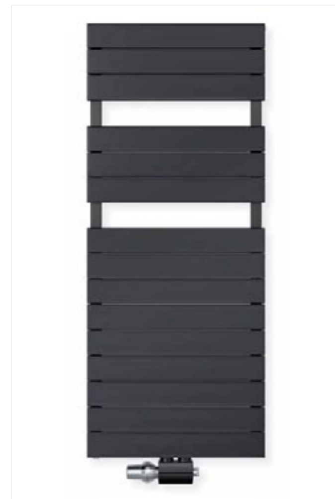
DREZNO-VM to grzejnik drabinkowy o nietypowej konstrukcji. Poziome profile grzewcze wykonano z płaskich i szerokich rur, tworząc silnie geometryczną bryłę, podkreśloną prostokątnymi kolektorami. Przyłącze ukryte w obudowie w kolorze grzejnika. Drezno-VM cechuje się niewielką głębokością przy relatywnie dużej mocy grzewczej. Większe odstępy między profilami, pozwalają ogrzać i wysuszyć ręcznik. Wymiary: szer. 500, 600, 700, 800 mm, wys. 800, 1250, 1500 mm

ponadczasowych to m.in. BERLIN, WIEDEŃ, PIZA, FLORENCJA. Stylowe wzornictwo prezentują GRAZ i GENEWA.