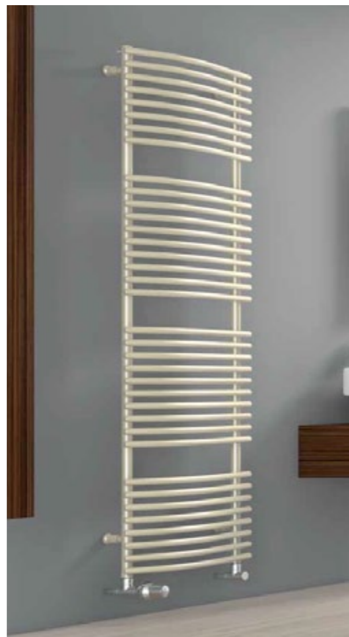
GENEWA – wyjątkowy grzejnik drabinkowy o asymetrycznie wygiętych profilach poziomych nadających mu indywidualnego charakteru połączonego z delikatną formą. Wymiary: szer. 500, 600, 750, 900 mm, wys. 800, 1200, 1800 mm