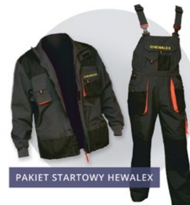
PAKIET STARTOWY HEWALEX