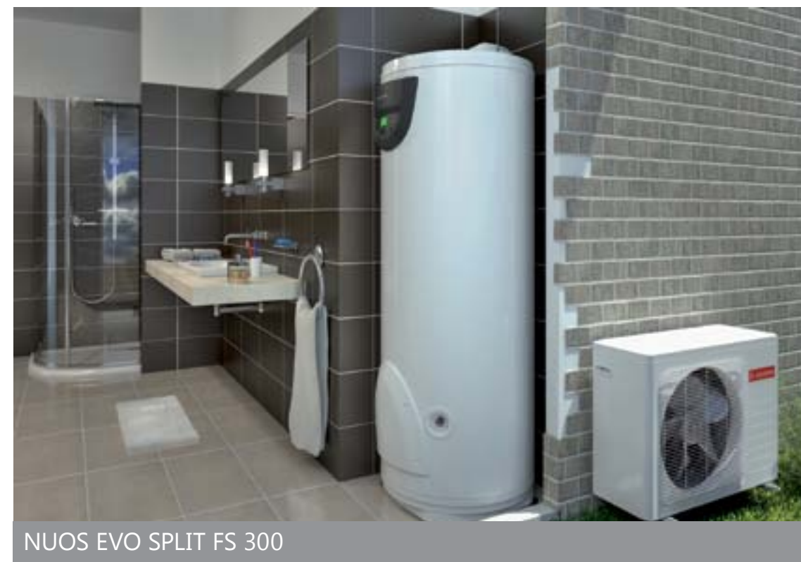
NUOS EVO SPLIT FS 300

w trybie pompy, gwarantując tym samym uzyskanie maksymalnych oszczędności. Funkcja Boost umożliwia podgrzanie wody w krót-