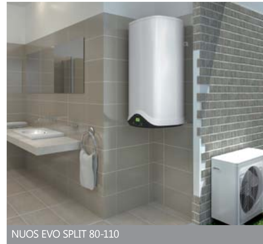
NUOS EVO SPLIT 80-110

W zależności od zapotrzebowania w ofercie Ariston Thermo dostępne są wiszące modele NUOS o pojemności 80, 100 i 120 litrów, NUOS EVO o pojemności 80 i 110 litrów, NUOS EVO SPLIT o pojemności 80 i 110 litrów oraz największa na rynku 200-litrowa wisząca wersja podgrzewacza – NUOS EVO SPLIT. Wersje stojące to NUOS EVO SPLIT FS o pojemności 300 litrów i NUOS o pojemności 200, 250 litrów, NUOS SOL 250 litrów – z dodatkową wężownicą. Wszystkie podgrzewacze linii NUOS mają wygodne w użytkowaniu funkcje m.in. ECO lub GREEN, która pozwala na pracę wyłącznie