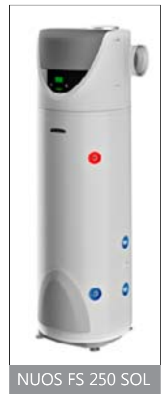
NUOS FS 250 SOL