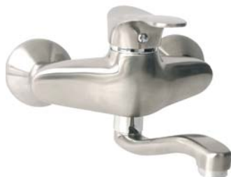
BTP3PVD bateria umywalkowa ścienna