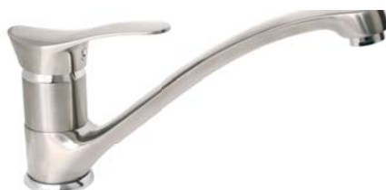
BTP4PVD bateria zlewozmywakowa stojąca