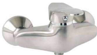
BTP7PVD bateria natryskowa ścienna