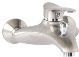
BTP1PVD bateria wannowa ścienna