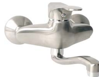
BTP5PVD bateria zlewozmywakowa ścienna