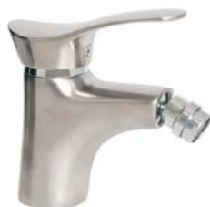
BTP6PVD bateria bidetowa stojąca