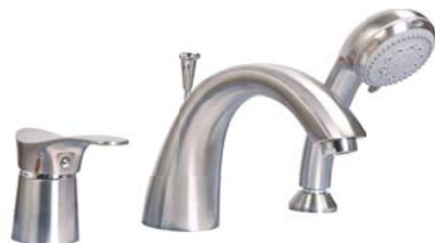
BTP11APVD bateria wannowa wielootworowa