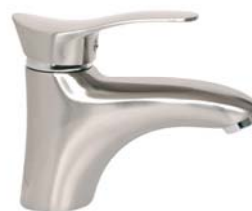
BTP2PVD bateria umywalkowa stojąca