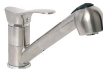
BTP8PVD bateria zlewozmywakowa stojąca z wyciąganym natryskiem