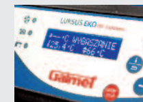
sterownik z PiD 1)