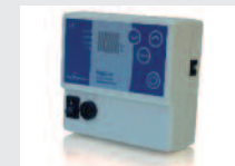
miarkownik ciągu UNISTER 1)