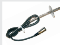
czujnik temperatury spalin 1)