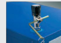
miarkownik ciągu tradycyjny 1)