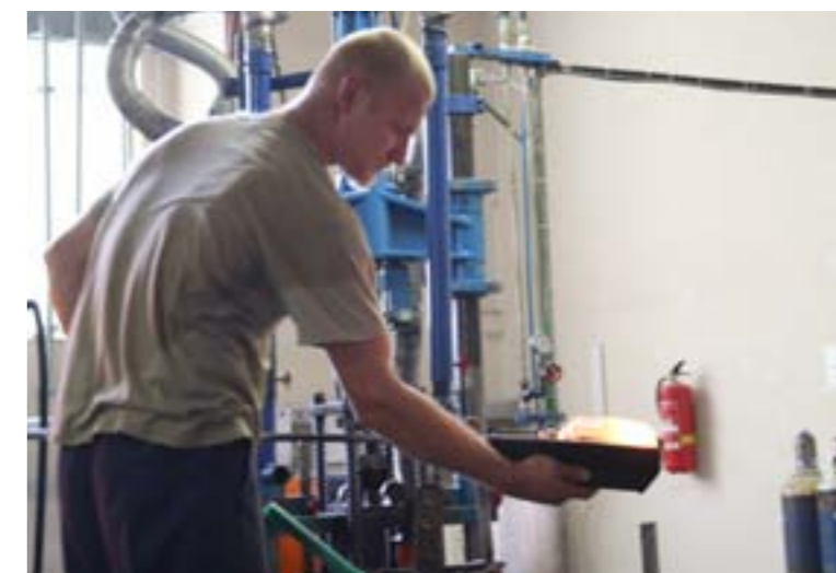
W skład niektórych akcesoriów łazienkowych wchodzi szkło. Wszystkie one produkowane są w Znojmo w piecu do wytopu szkła, a następnie wypalane w wysokiej temperaturze

W 2010 r. spółka NOVASERVIS wypracowała przychody ze sprzedaży w wysokości 102 mln zł oraz zysk EBITDA na poziomie 25,5 mln zł.