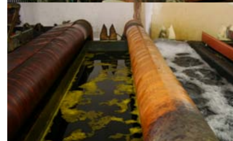
Na etapie produkcji zarówno baterie, wiele elementów armatury sanitarnej, czy akcesoria łazienkowe poddawane są różnym procesom mającym na celu przygotowanie i zabezpieczenie korpusów, powłok...