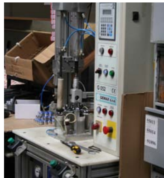
NOVASERVIS bardzo restrykcyjnie podchodzi do standardów jakościowych, zarówno samych produktów, jak i poszczególnych etapów produkcji. Jakość baterii sprawdzana jest na stanowiskach testowych

NOVASERVIS jest czeską spółką działającą na rynku armatury sanitarnej i instalacyjnej. Od 2006 r. właścicielem NOVASERVIS był fundusz KBC Private Equity. NOVASERVIS działa przede wszystkim na rynkach w Czechach i Słowacji, gdzie zajmuje pozycję jednego z czołowych producentów armatury sanitarnej. W Czechach NOVASERVIS jest liderem rynku pod względem wielkości sprzedaży baterii (udział w rynku na poziomie