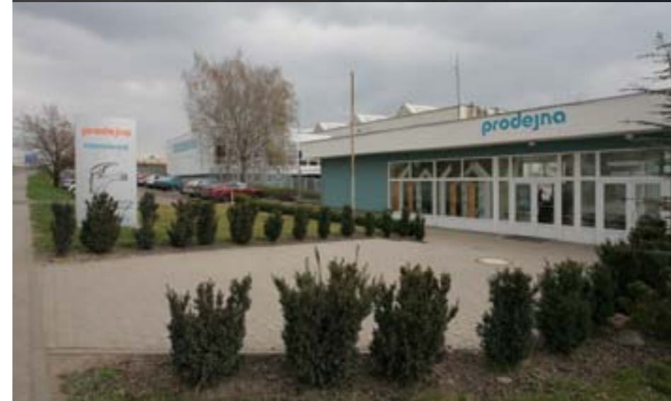
Fabryka NOVASERVIS w Znojmo

Grupa FERRO od kwietnia jest właścicielem NOVASERVIS – największego czeskiego producenta m.in. baterii i akcesoriów łazienkowych. Jak jednak wygląda produkcja w zakładzie w Znojmo? Jakie baterie, w jaki sposób i w jakiej ilości są tam produkowane? Jak duża jest różnorodność akcesoriów łazienkowych? Jak rozwiązany jest system realizacji zamówień? Naocznie mogliśmy się o tym przekonać podczas wizyty w fabryce NOVASERVIS w Znojmo.