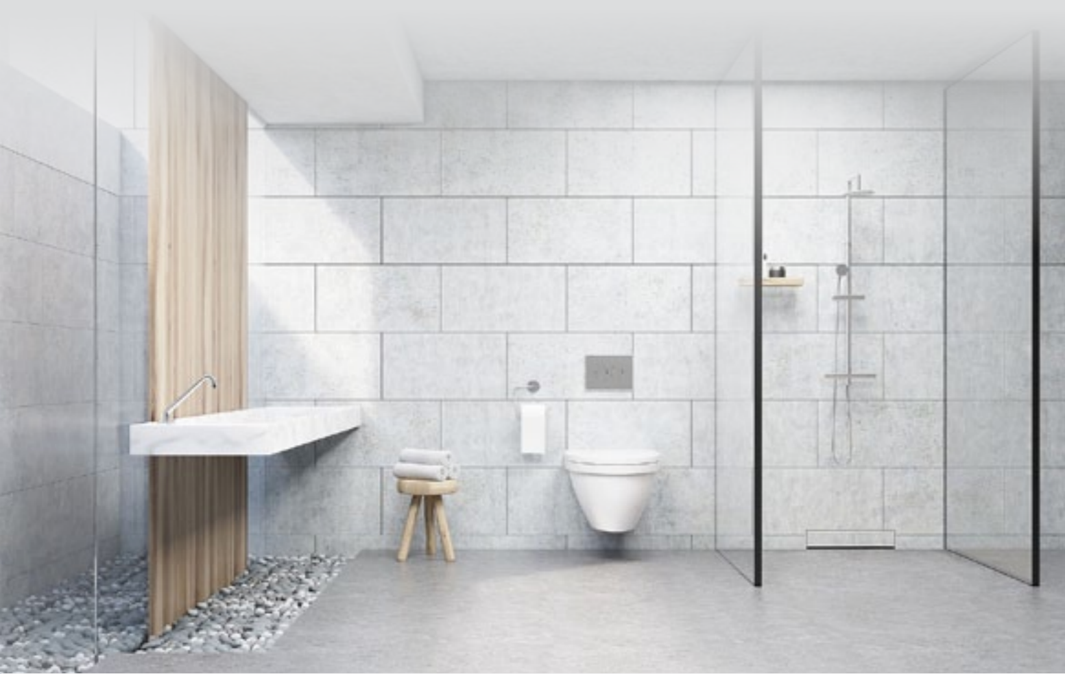
Wpust ścienny z maskownicą pod płytkę

Przemyślana i innowacyjna technologia, wyrazisty design i możliwość dopasowania do własnych potrzeb to cechy produktu, który dyktuje nowe trendy na rynku. Zgodnie z tymi założeniami stworzona została linia odpływów łazienkowych Aqua Ambient.