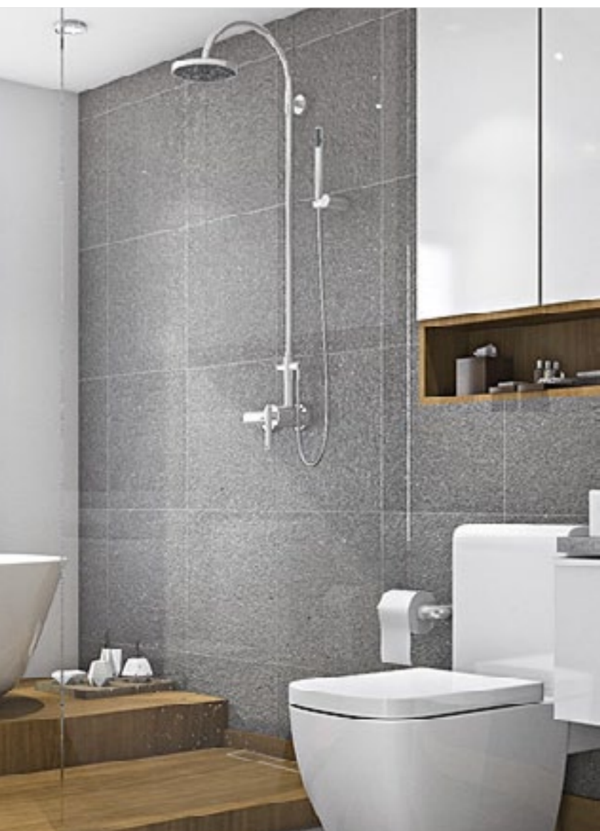
Wpust liniowy w wersji pod płytkę

W obu przypadkach ruszty pełnią wyłącznie funkcję maskownicy oraz rewizji syfonu odprowadzającego wodę. Łazienkowe wpusty ściennie mają zintegrowany kołnierz uszczelniający. Rynny odpływowe zostały wyposażone w złącze uziemiające. Przemysłowa konstrukcja zapewnia możliwość regulacji wysokości i głębokości zabudowy oraz umożliwia wy poziomowanie dzięki 4 niezależnym nóżkom. Wpust ścienny wykonany jest z najwyższej jakości materiałów odpornych na korozję, a pełny dostęp do syfonu ułatwia czyszczenie i konserwację. Przepływ odpływów ściennych to 48 l/min.