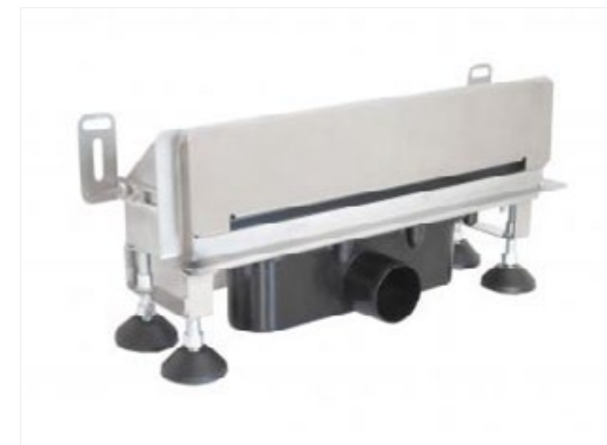
Wpust ścienny z maskownicą polerowaną

Ścienne wpusty mają dwie możliwości zabudowy: poprzez zastosowanie rusztu z polerowanej stali nierdzewnej lub zastosowanie rusztu pod wklejenie