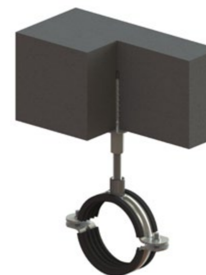
TSMW – schemat