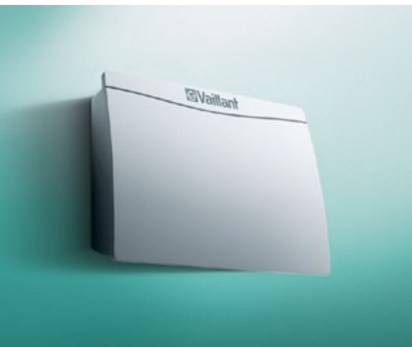
Moduł komunikacji internetowej VR 900