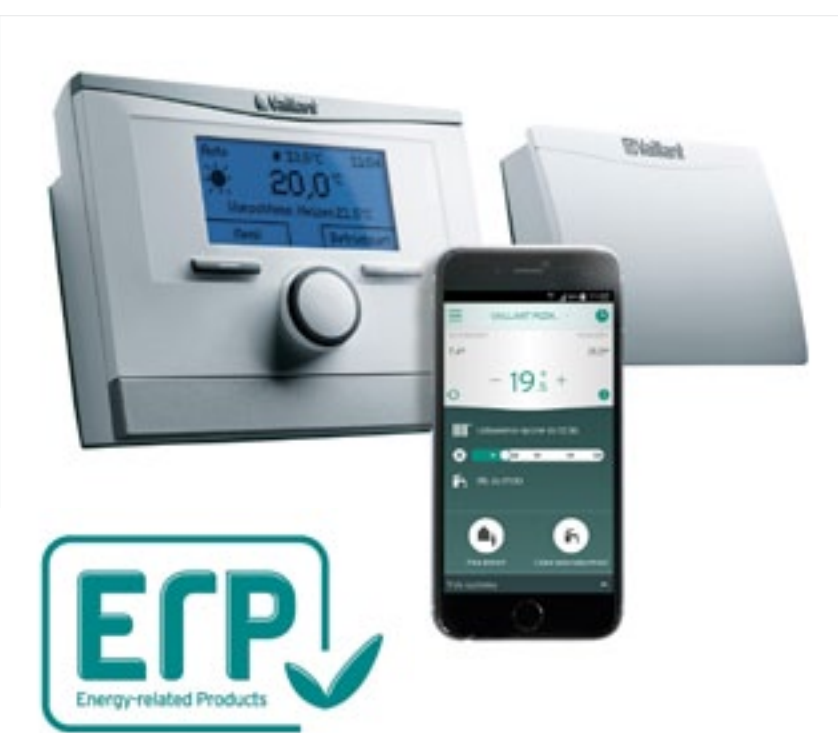
Klasa energetyczna A+ dla zestawu z regulatorem multiMATIC VRC 700