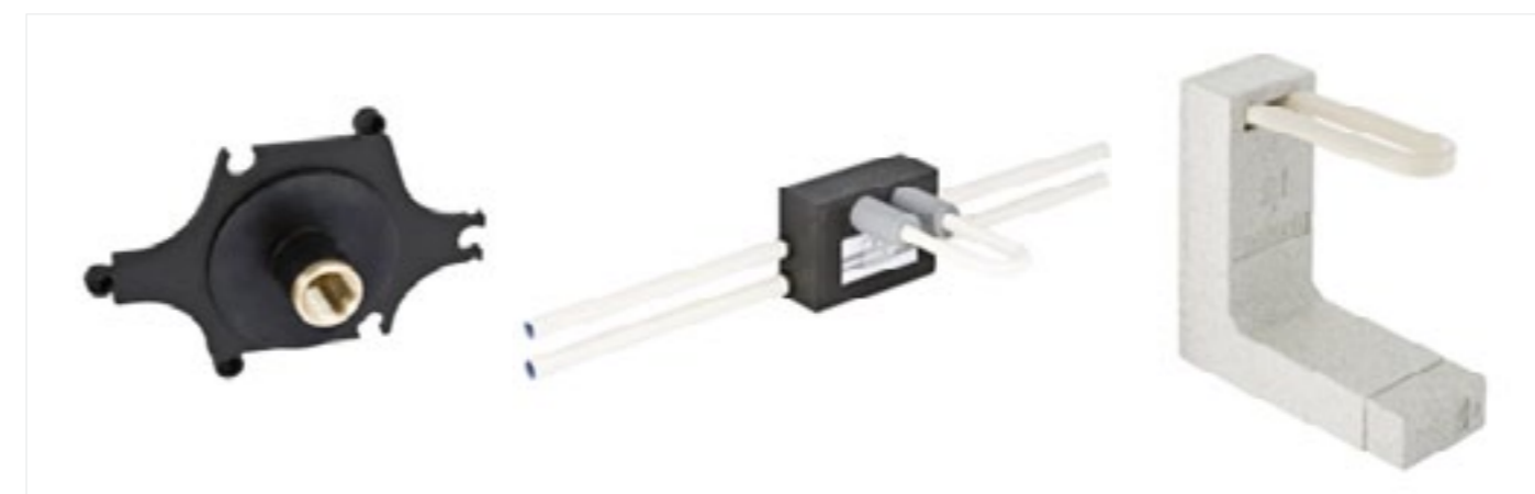
Specjalne kształtki systemu Mepla

Do produkcji systemów rurowych Geberit używa wy-