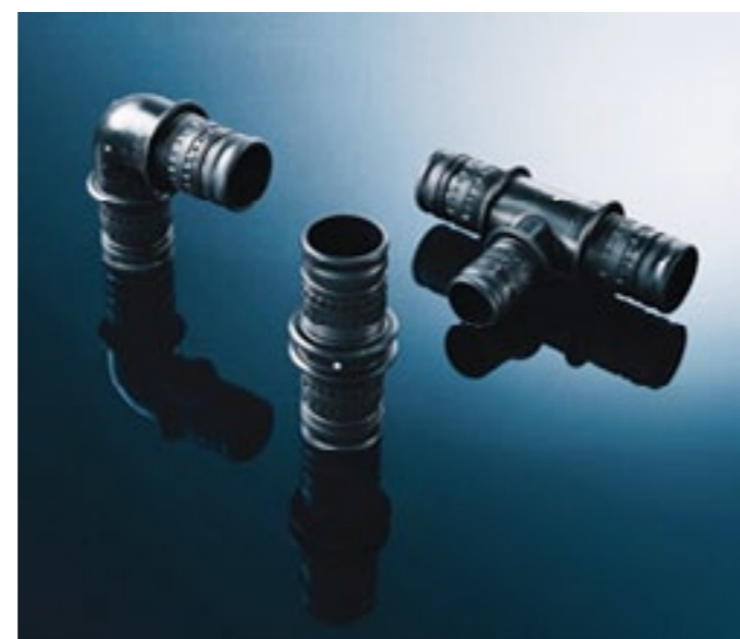
Kształtki Mepla mają specjalną konstrukcję końcówki

Połączenia są najbardziej wrażliwą częścią instalacji, dlatego Geberit przywiązuje tak wielką wagę do ich bezpieczeństwa. Wszystkie kształtki Mepla do standardowych instalacji wodnych (woda i c.o.) wyposażone są w system „niezaciśnięte-nieszczelne”, co oznacza, że już po napełnieniu instalacji ewentualne niezaprasowane połączenia będą łatwo rozpo-