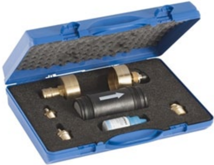
Specjalny filtr zabezpieczający instalację przed wtórnym zanieczyszczeniem

łącznie najlepszych materiałów. W rurach Geberit Mepla warstwa aluminium, która decyduje o stabilności i wytrzymałości układu, jest najgrubsza wśród wszystkich systemów spotykanych na rynku. Dzięki temu