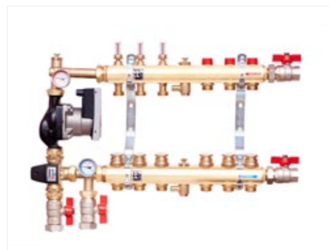
Rozdzielacze Colmix PG