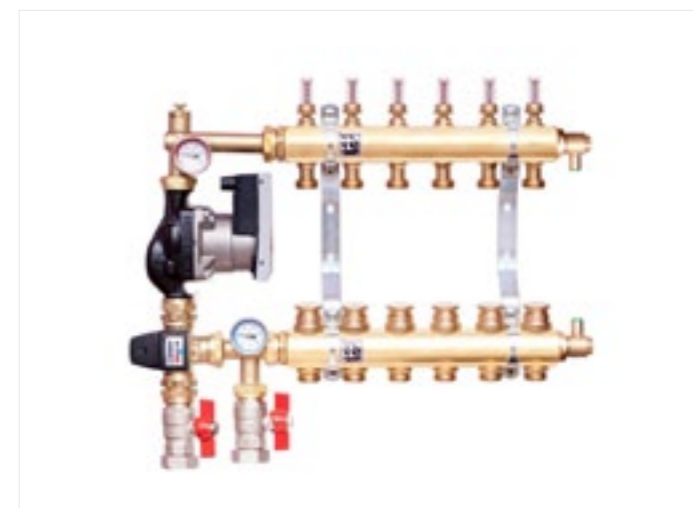
Rozdzielacze Colmix R