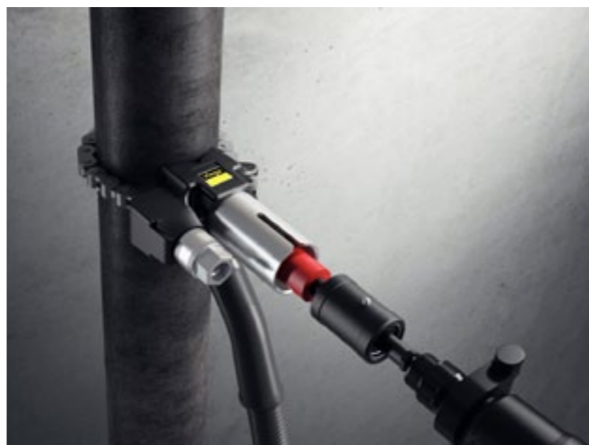
Następnie podłączamy odkurzacz, wsuwamy wiertło z koronką i nawiercamy otwór