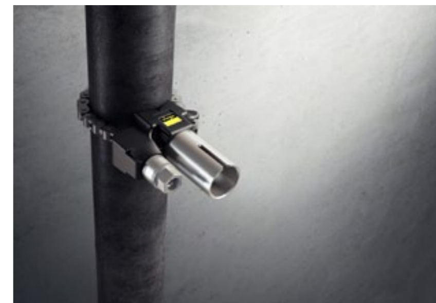
Żeby zainstalować przyłącze zaprasowywane, należy najpierw zamontować specjalnie opracowany przyrząd wiertarski