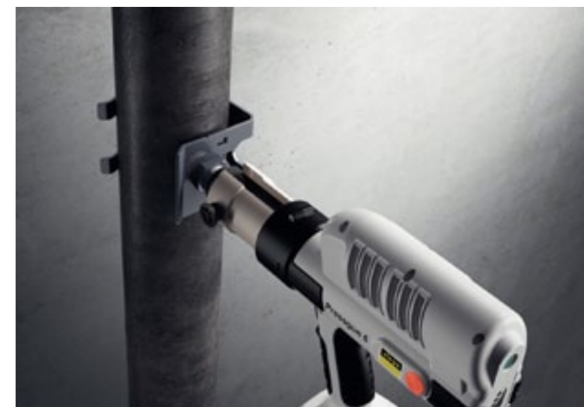
Dzięki specjalnemu elementowi pomocniczemu precyzyjnie ustawiamy przyłącze, wciskamy i zaprasowywujemy za pomocą zaciskarki Viega

Przyłącze Megapress jest wykonane ze stali niestopowej pokrytej galwaniczną powłoką cynkowo-niklową i dostępne jest do zastosowania na siedmiu średnicach rur: od 1 1/2" do 6". Po prawidłowym zaprasowaniu złączki powstaje trwałe i szczelne połączenie z rurą.