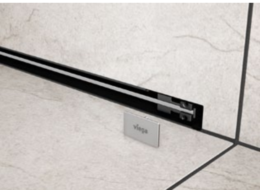
Po ułożeniu płytek i zafugowaniu można zamocować ruszt i płytki ozdobne

Niezwykle wąski, nagrodzony licznymi nagrodami w dziedzinie designu, z możliwością przycięcia na dowolną długość – to właśnie te cechy zapewniły odptywowi Advantix Vario firmy Viega sukces rynkowy. Nowa wersja tego odwodnienia pozwala wykorzystać wszystkie wymienione zalety również w przypadku montażu w ścianie.