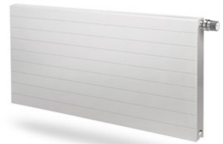
Plan Ventil Compact

Grzejniki w wysokości zaledwie 200 mm to ukłon w stronę właścicieli mieszkań, których wnętrza zostały zaprojektowane z dużymi oknami, przeszkleniami czy nietypowymi wymiarami ścian. To również doskonałe rozwiązanie dla wszystkich, którzy chcą zaaranżować przestrzeń sypialni, jadalni bądź salonu indywidualnie, w subtelny i minimalistyczny spo-