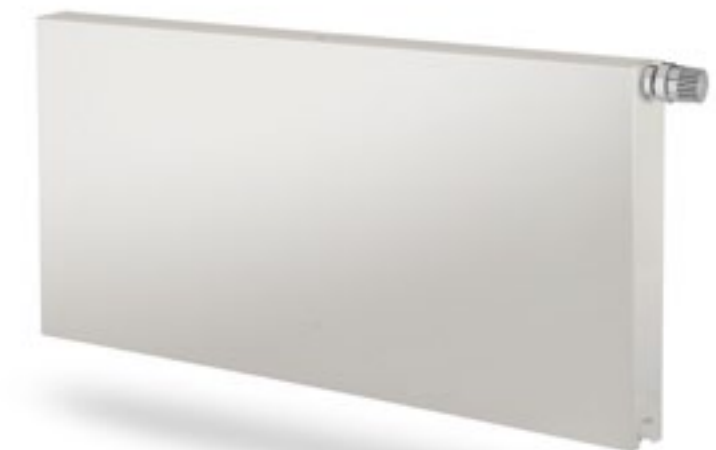
Ramo Ventil Compact