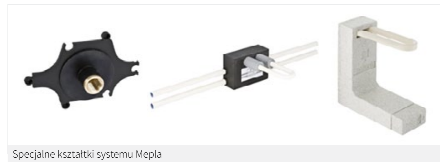
Specjalne kształtki systemu Mepla

Wszystkie rury i kształtki systemów zaciskowych Geberit są fabrycznie zabezpieczone przed ewen-