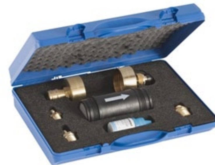
Specjalny filtr zabezpieczający instalację przed wtórnym zanieczyszczeniem

łącznie najlepszych materiałów. W rurach Geberit Mepla warstwa aluminium, która decyduje o stabilności i wytrzymałości układu, jest najgrubsza wśród wszystkich systemów spotykanych na rynku. Dzięki temu rury Mepla, jako jedyne, mogą być zaciskane bezpo-