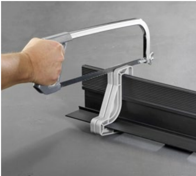
Odptyw ścienny można dociąć na dowolny wymiar

o wyższej konstrukcji – 90 mm. Wysokość tę można elastycznie zwiększyć do 165 mm. Ponieważ woda spływa na całej długości odptywu, wystarczy spadek 1-2%, by zapewnić efektywne odprowadzanie. Wydajność odptywu wynosi od 0,6 do 0,9 l/s, zgodnie z normą PN-EN 1253. Króciec przyłączeniowy DN40 lub DN50 można obrócić o 360°.