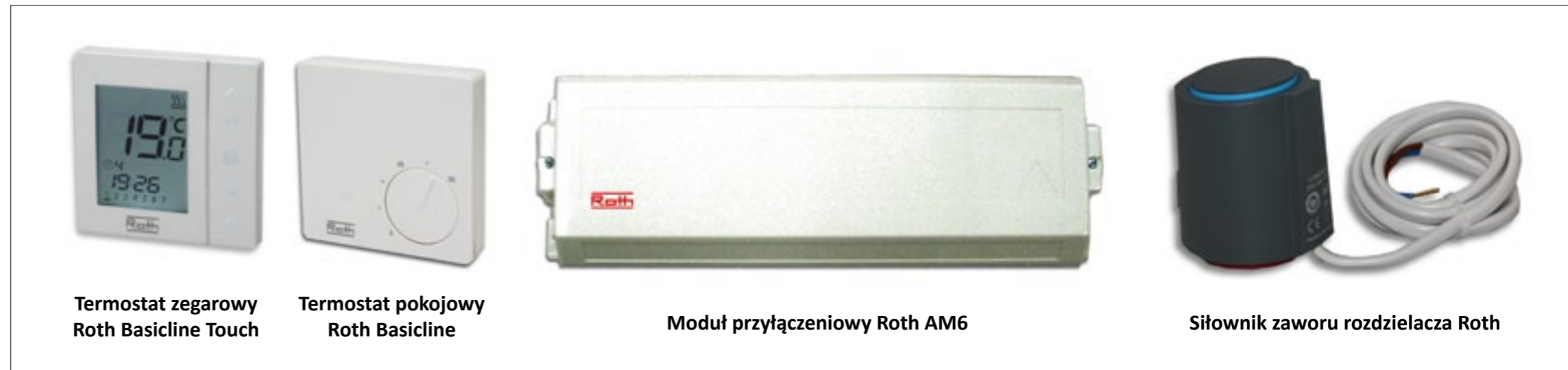
Termostat zegarowy Roth Basicline Touch

umożliwia połączenie maks. 5 siłowników rozdzielacza z 1 termostatem pokojowym lub zegarowym. Możliwe jest również połączenie obwodów grzewczych z 1 termostatem poprzez mostkowanie w piątym zacisku. Siłownik zaworu rozdzielacza 1 Watt przeznaczony jest do montażu na zaworach odcinających kolektora powrotnego rozdzielaczy. Model fabrycznie bezprądowo zamknięty, jego praca sterowana jest za pomocą termostatów: poprzez instalację elektryczną przekazywany jest sygnał sterujący do siłownika zaworu celem jego otwarcia. ■