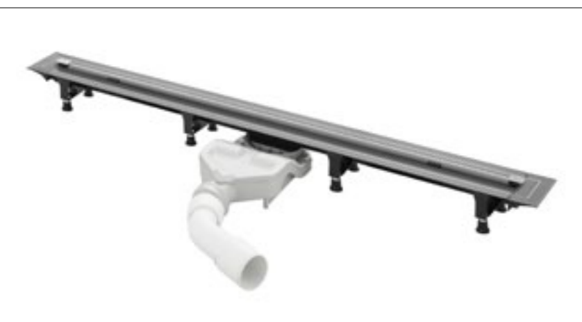
Pomimo niskiego korpusu wydajność odpływu Advantix Vario w wersji do prac modernizacyjnych wynosi min. 0,55 l/s

Advantix Vario w wersji do remontów idealnie sprawdza się podczas renowacji łazienek. Niezwykle niską wysokość zabudowy (zaledwie 70 mm) osiągnięto dzięki nowej konstrukcji odpływu. Mimo płaskiego korpusu wydajność odwodnienia wynosi min. 0,55 l/s, a w razie potrzeby można ją jeszcze podwoić. W tym celu wystarczy połączyć ze sobą dwa odpływy. Wysokość zamknięcia wodnego 25 mm skutecznie zabezpiecza przed nieprzyjemnymi zapachami z kanalizacji.