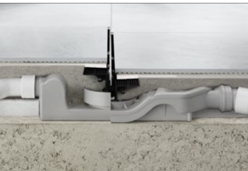
Nowy model Advantix Vario (z prawej strony) mieści się na znacznie mniejszej przestrzeni zabudowy niż tradycyjna wersja