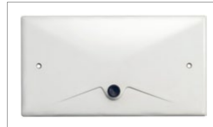
Rok 1964: Pierwszy przycisk spłukujący Geberit dla spłuczek podtynkowych

nologia. Geberit rozpoczął seryjną produkcję podtynkowych spłuczek całkowicie ukrytych za ścianą zaledwie dwa lata wcześniej. Rozwiązanie to było pewnym wyzwaniem dla niektórych użytkowników, ponieważ większość gości nigdy wcześniej nie widziała przycisku do spłukiwania umieszczonego w ścianie. Zamontowane wtedy spłuczki działały w hotelu do 2013 r. Przeprowadzono wtedy generalny remont pokoi hotelowych wraz z łazienkami, w ramach którego zdemontowano