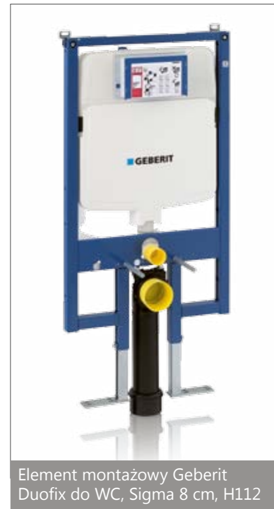
Element montażowy Geberit Duofix do WC, Sigma 8 cm, H112