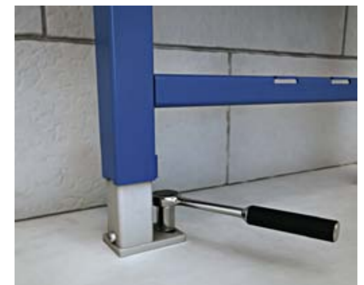
Nogi ocynkowane, regulowane płynnie w zakresie 0-20 cm