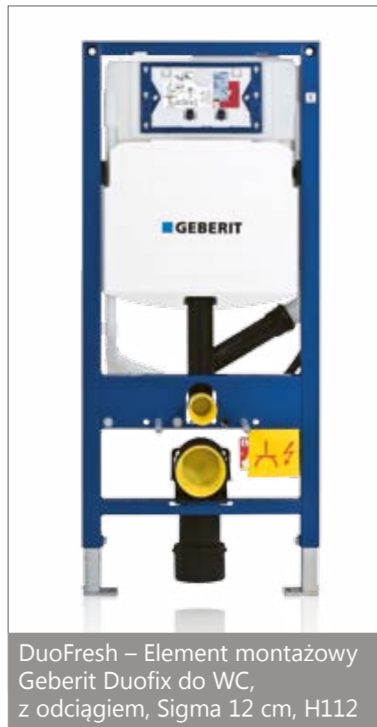
DuoFresh – Element montażowy Geberit Duofix do WC, z odciążeniem, Sigma 12 cm, H112

Nie do pominięcia są również inne zalety ste-