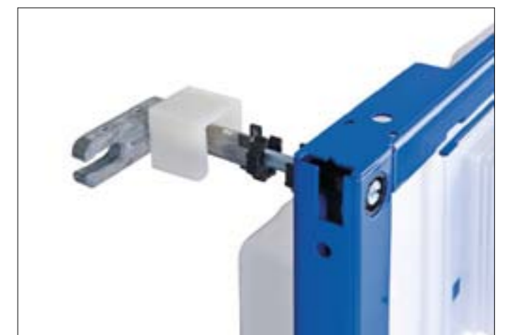
Wsporniki dystansowe Geberit Duofix