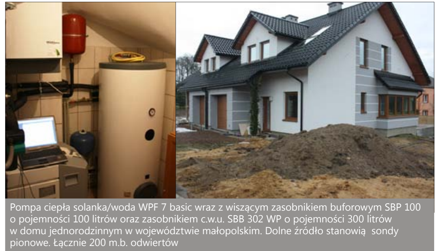
Pompa ciepła solanka/woda WPF 7 basic wraz z wiszącym zasobnikiem buforowym SBP 100 o pojemności 100 litrów oraz zasobnikiem c.w.u. SBB 302 WP o pojemności 300 litrów w domu jednorodzinnym w województwie małopolskim. Dolne źródło stanowią sondy pionowe. Łącznie 200 m.b. odwiertów

Świadomy inwestor dziś traktowany jest już nie jak zmora, a raczej partner w procesie inwestycyjnym. Dobrze zamontowana pompa ciepła, to późniejsza pewność i bezawaryjność jej działania. Na etapie montażu jest sporo aspektów, na które trzeba zwrócić uwagę. Poniżej omawiamy zagadnienia, które warto poruszyć w rozmowie z inwestorem i o które on może nas zapytać.