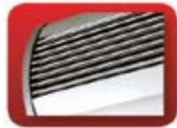
aluminiowa kratka czerpna