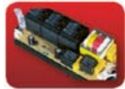
automatyczne zabezpieczenie przed przegrzaniem