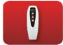
pilot zdalnego sterowania