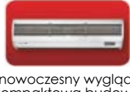
nowoczesny wygląd, kompaktowa budowa