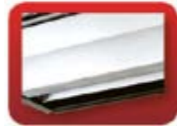
regulowana kratka wylotowa