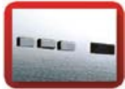
zintegrowany panel sterowniczy