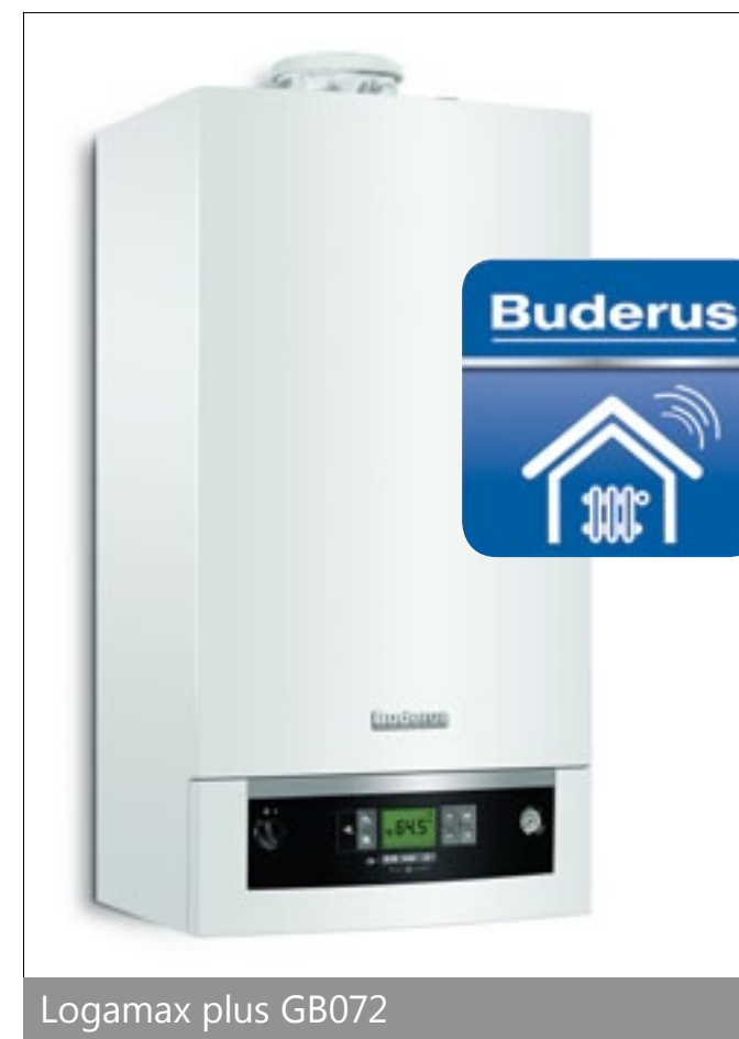
Logamax plus GB072

z mobilnym sterowaniem i kontrolą z dowolnego miejsca