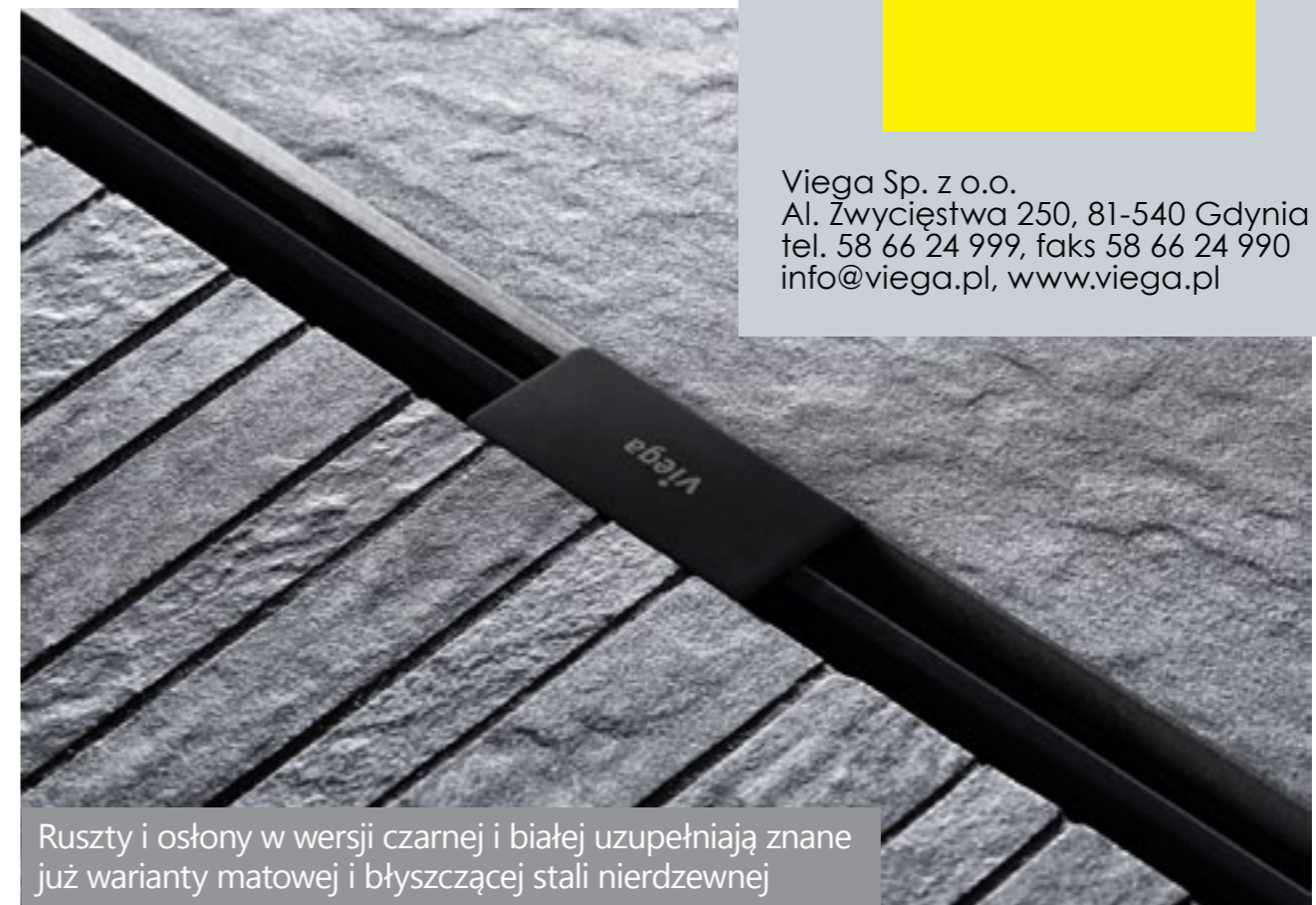
Ruszty i osłony w wersji czarnej i białej uzupełniają znane już warianty matowej i błyszczącej stali nierdzewnej