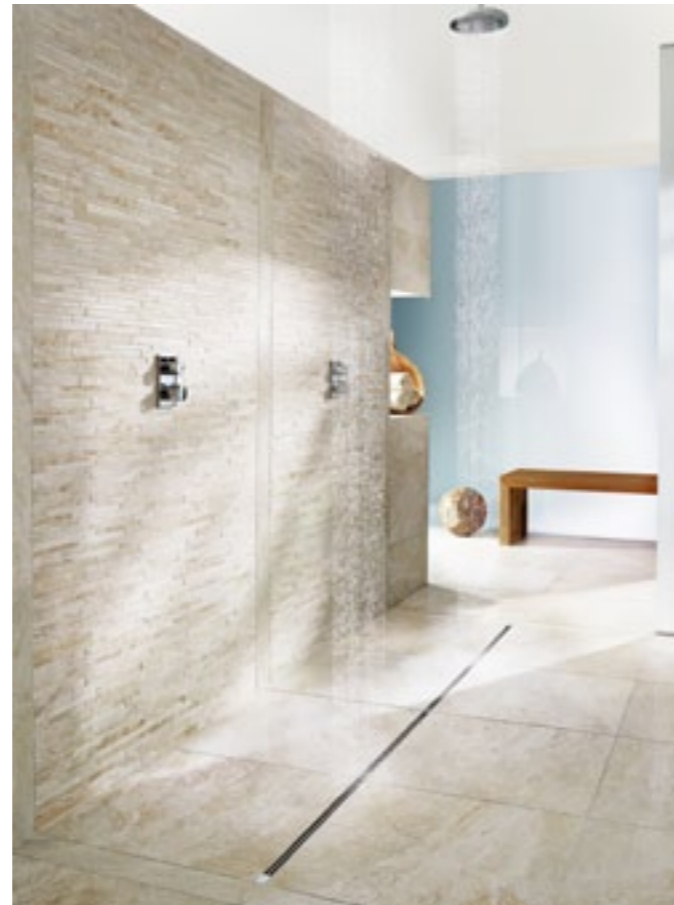
Advantix Varioo (o długości do 280 cm) znalazł uznanie także w oczach jury German Design Award 2013

Standardowa długość odpływu liniowego Advantix Vario wynosi 120 cm. W razie potrzeby można go dowolnie skrócić nawet do 30 cm. Nowy łącznik, łącznik narożny oraz element zamykający, jeszcze bardziej rozszerzają możliwości tego rozwiązania. Wszystkie one mają długość 20 cm i można je łatwo łączyć z odpływem liniowym poprzez zwykłe włożenie i przykręcenie wkrętami.