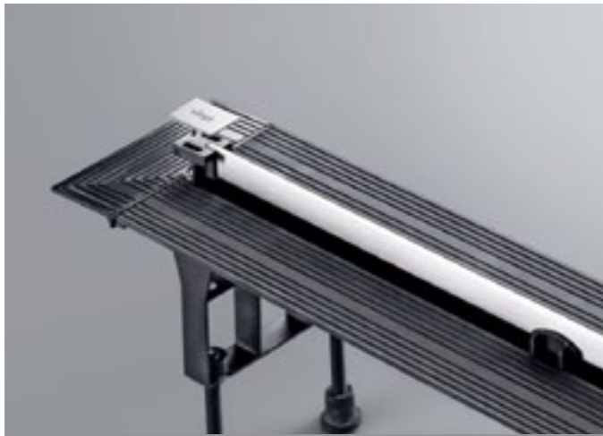
Nóżki o płynnej regulacji pozwalają na precyzyjne ustawienie górnej krawędzi odpływu względem podłoża