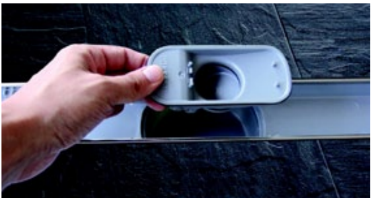
Suchy syfon Multistop – osprzęt do odpiłów Linearis Compact/Comfort

Odpiły łazienkowe mogą zostać dodatkowo wyposażone w suchy syfon Multistop chroniący przed nieprzyjemnymi zapachami powstałymi na skutek wysychania wpustów. Problem ten dotyczy najczęściej łazienek rzadko używanych np. przeznaczonych dla gości oraz łazienek z ogrzewaniem podłogowym. Suchy syfon można zamontować w już zabudowanych odpiłach – wystarczy wyjąć z odpiły syfon wodny i w jego miejsce włożyć syfon Multistop. Zasada działania jest bardzo prosta: syfon ma klapkę, która otwiera się samoczynnie podczas przepływu ścieków i pozwala na ich swobodny odpływ. Następnie klapa powraca do pozycji podstawowej (zamkniętej) i zapobiega w ten sposób przedostawaniu się nieprzyjemnych zapachów z kanalizacji. ■