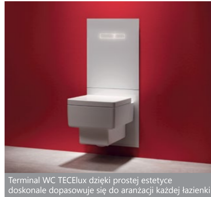
Terminal WC TECElux dzięki prostej estetyce doskonale dopasowuje się do aranżacji każdej łazienki

Nowa propozycja firmy TECE Terminal WC TECElux, łączy cechy innowacyjnego urządzenia sanitarnego i estetycznej ozdoby w łazience. Idealnie płaska, szklana płyta urządzenia zamyka otwór rewizyjny, skutecznie ukrywając spłuczkę, przyłącza wody, prądu i – zależnie od stopnia rozbudowy – również oczyszczacz powietrza.