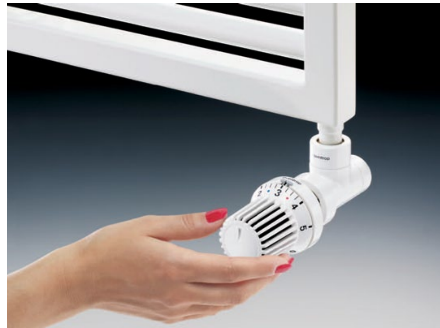
Termostat „Uni XH” i zawór typoszeregu E.

Wszystkim sympatykom firmy Oventrop i Marki Instalatora najlepsze życzenia z okazji Świąt Bożego Narodzenia i Nowego Roku składają pracownicy firmy Oventrop Sp. z o.o.