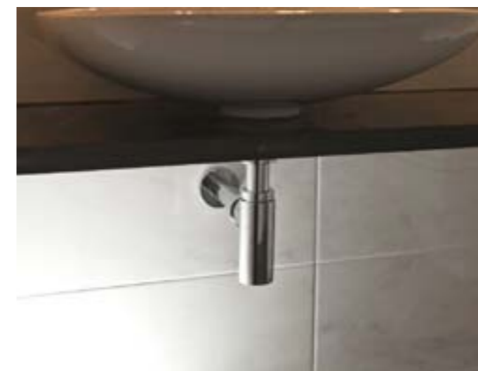
Chromowane syfony Eleganta 1 dodają uroku umywalkom, a jednocześnie charakteryzują się doskonałymi właściwościami technicznymi

To samo można powiedzieć o stylizowanych, chromowanych syfonach Eleganta 1 , które dodają uroku umywalkom, a jednocześnie charakteryzują się doskonałymi właściwościami technicznymi. ■