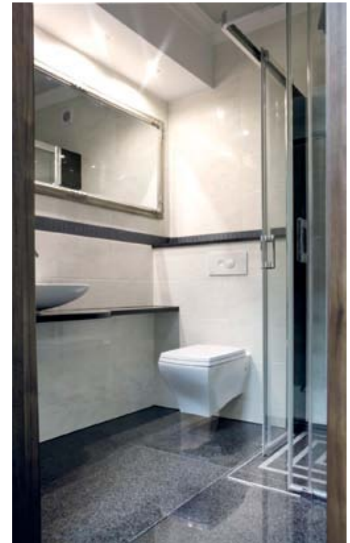
W hotelowych łazienkach zainstalowano 70 stelaży Eco Plus z wodooszczędnymi spłuczkami Visign 2 i płytkami uruchamiającymi Visign for Style 10