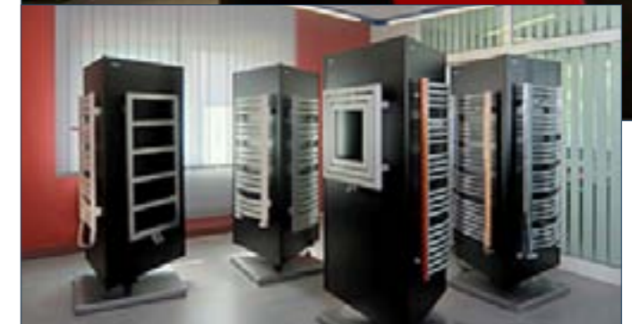
Obiekt biurowy firmy Enix wraz z ekspozycją grzejników