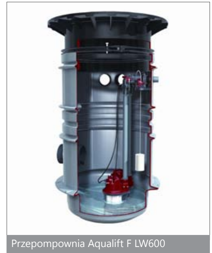
Przepompownia Aqualift F LW600

Przepompownia Aqualift F w systemie stu- dzienek KESSEL LW 600 przeznaczona jest do ścieków zawierających fekalia i bez fe- kaliów, do zabudowy w ziemi na zewnątrz budynków.