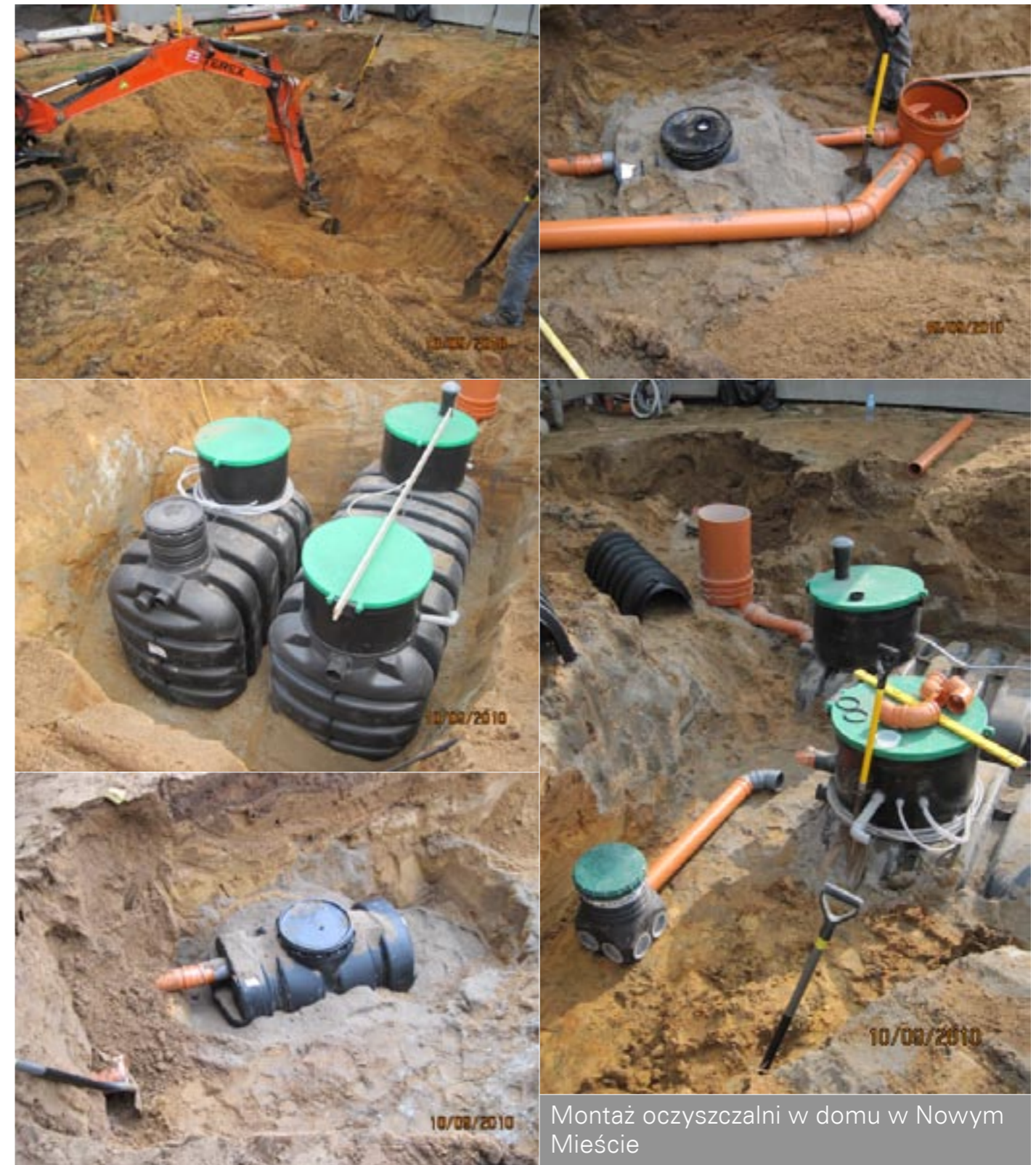
Montaż oczyszczalni w domu w Nowym Mieście

we jest sterowanie oświetleniem, roletami, ogrzewaniem, klimatyzacją, oczyszczalnią itp. za pomocą jednego systemu zastępującego oddzielne urządzenia i układy ste-