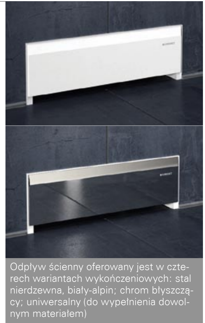
Odpyw ścienny oferowany jest w czterech wariantach wykończeniowych: stal nierdzewna, biały-alpin; chrom błyszczący; uniwersalny (do wypełnienia dowolnym materiałem)