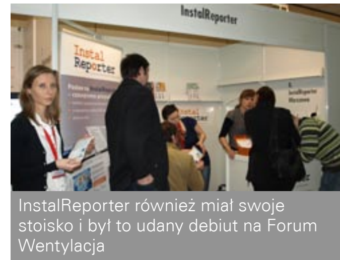
InstalReporter również miał swoje stoisko i był to udany debiut na Forum Wentylacja

Aktualne informacje o wystawie, wystawcach, nowych produktach, formularz zgłoszenia online są dostępne na www.forumwentylacja.pl