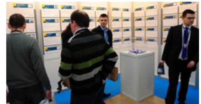
Konkurs na najciekawszy produkt

Nowością w roku 2011 było seminarium dla architektów. Przygotowane wspólnie przez Stowarzyszenie Polska Wentylacja i Izbę Architektów RP zgromadziło około 100 praktykujących projektantów. Tematykę i formę wykładów przygotowano w taki sposób, aby były one jak najbardziej przydatne dla architektów. Przedstawiono zarówno zaga-